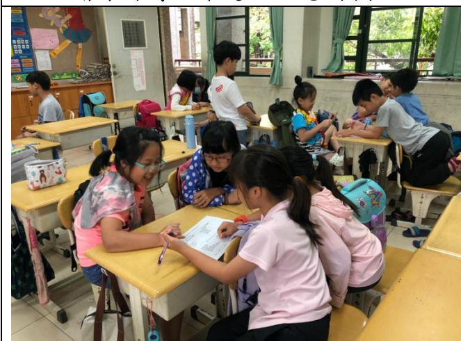
日期:110年4月20日 說明:感興趣的環境議題--小組討論