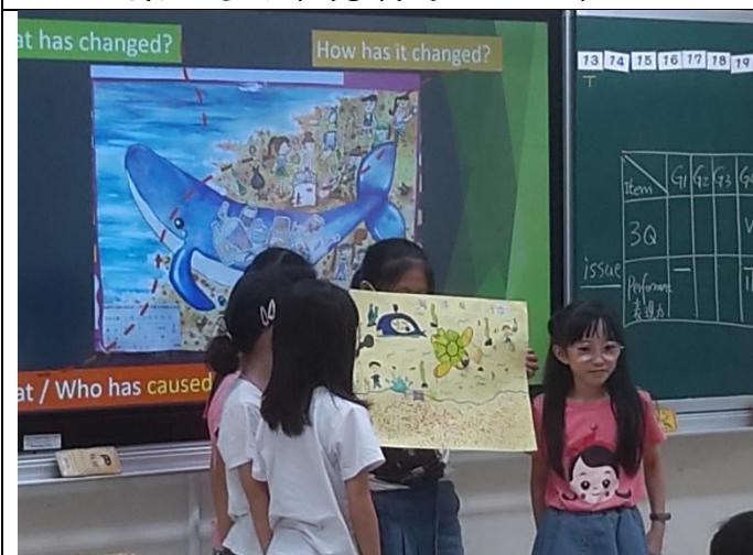
日期:110年5月4日 說明:學生上台分享「環境議題海報」