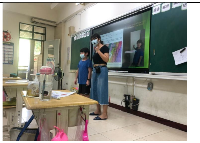
日期:110年5月11日 說明:個人的節能護地球—環保行動