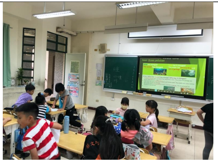
日期:110年4月13日 說明:了解環境保護議題及發生原因