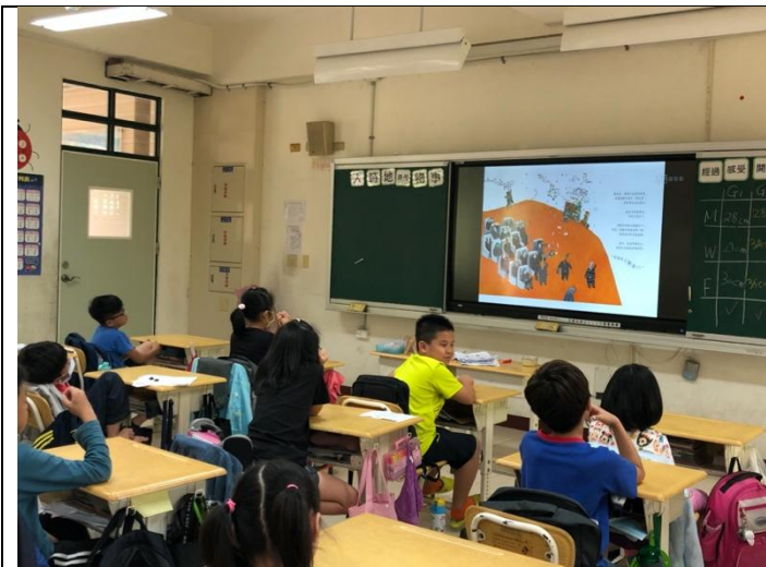
日期:110年4月6日 說明:繪本分享--都是放屁惹的禍