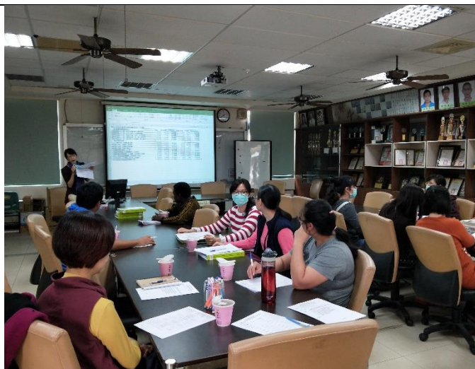
主任報告、說明本次會議的議題