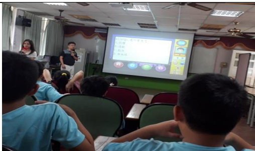
課程名稱：探索過敏