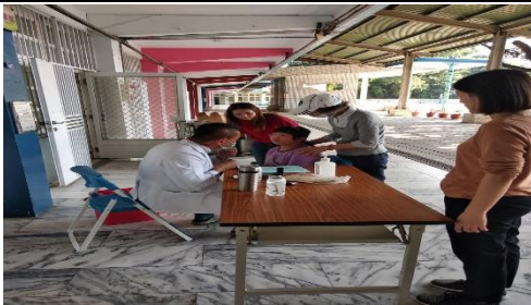
課程名稱：流感追緝令