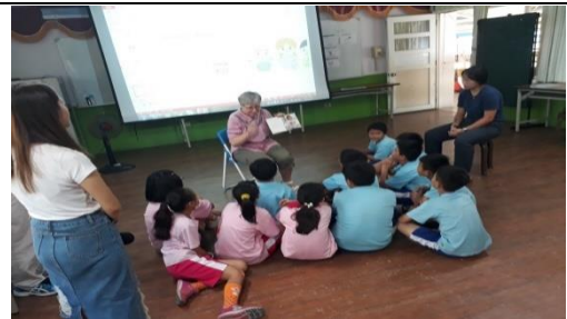
課程名稱：寶貝我的牙齒