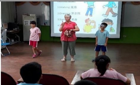
課程名稱：護眼小專家