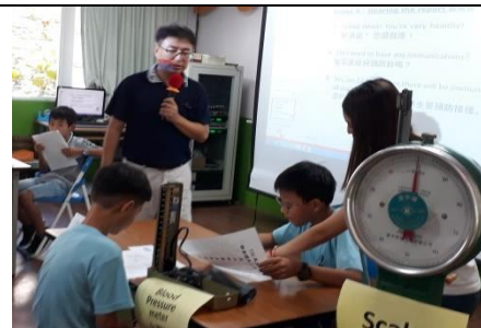
課程名稱：就醫停、看、聽說明：