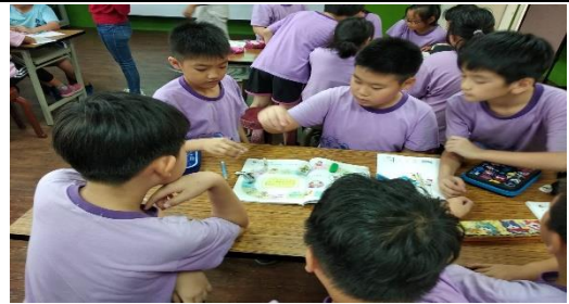
課程名稱：流感追緝令