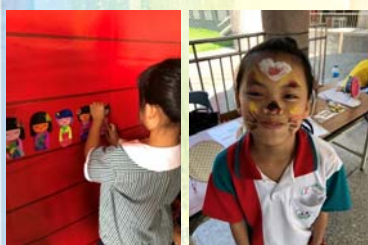
各國兒童節體驗～ 日本女兒節 哥倫比亞兒童節