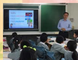
108.3 觀課議課綜合領教師~校長，課堂英語使用比率超過9成