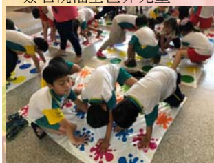
透過互助分組共同合作完成 英語挑戰關卡

願 世上的兒童都能平等 ，不為身份的不同而受到 差別對待或歧視，享有社 會安全的利益，獲得適當 的營養、醫療服務、照顧 及受教育的權利。