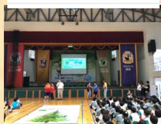
兒童發表宣言，並祈福樹上 簽名祝福全世界兒童