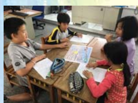
108.1 觀課議課自製教具使用