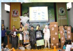
各班級利用環保材質裝扮各班的鬼王進行裝扮比賽