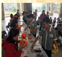
完成教學闖關挑戰取得鬼屋入場卷