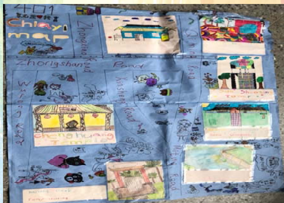
嘉義地圖～ 學校附近英文版