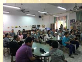
107.12 觀課議課夥伴教師群