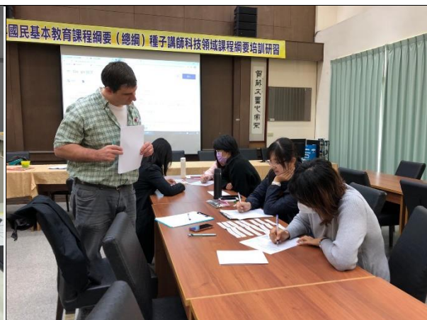
校外外籍教師及校長參與共備