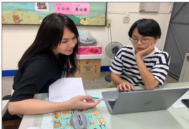
美術教師與英語教師定期共備