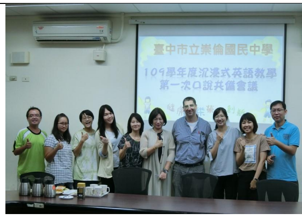
僑泰高中外語部外師定期共備