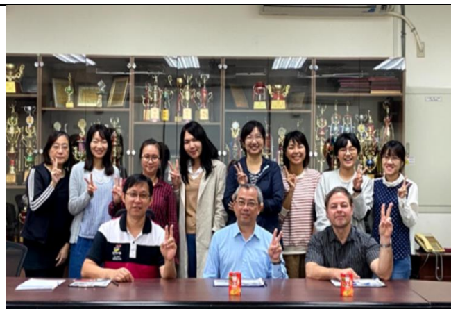
新民高中國際部外師定期共備