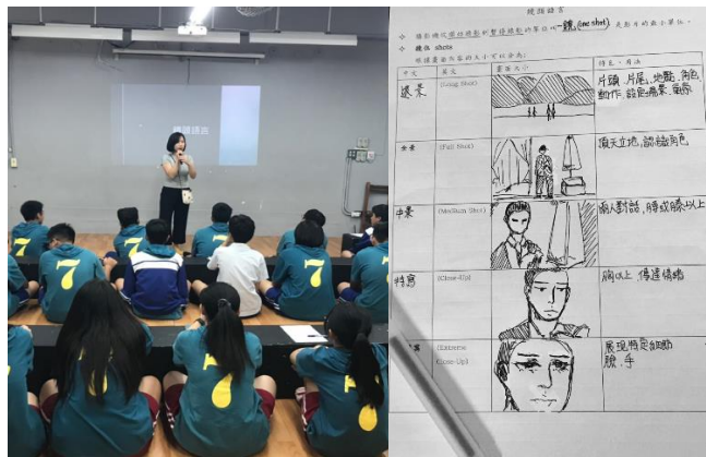
日期:108.9.12 說明: 講解鏡頭語言