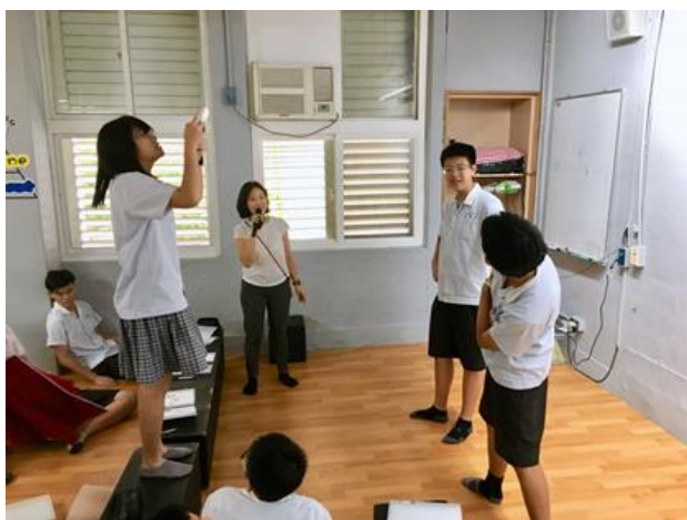
日期: 108.9.26 說明: 拍攝角度與實作討論