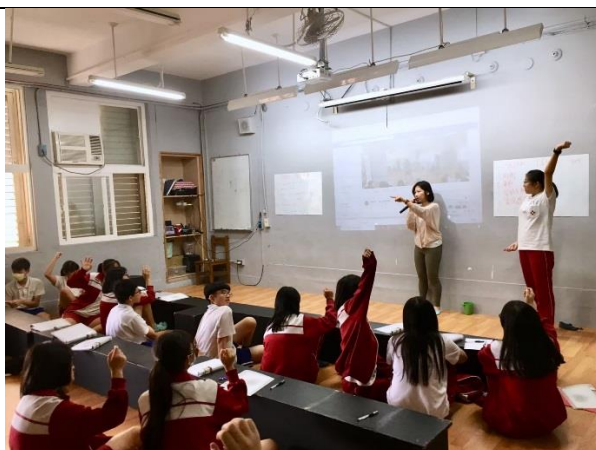
日期: 108.10.29 說明:拍攝作業分享