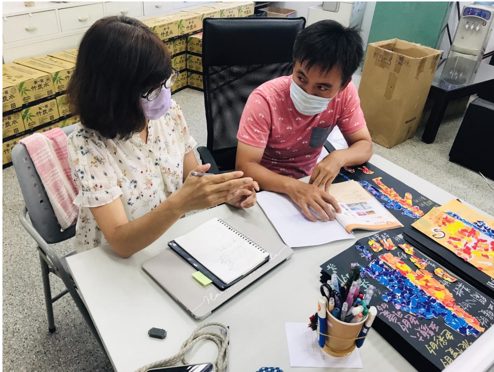
領域教師與英語教師共同備課