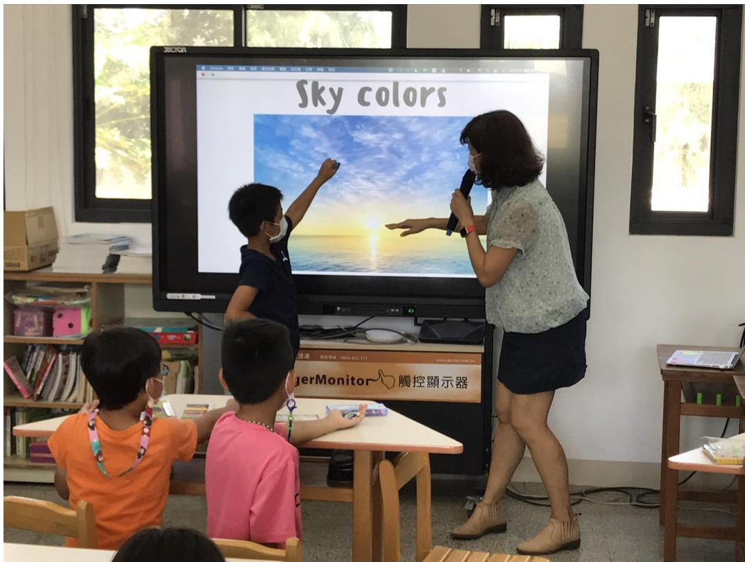
活動操作介紹與討論