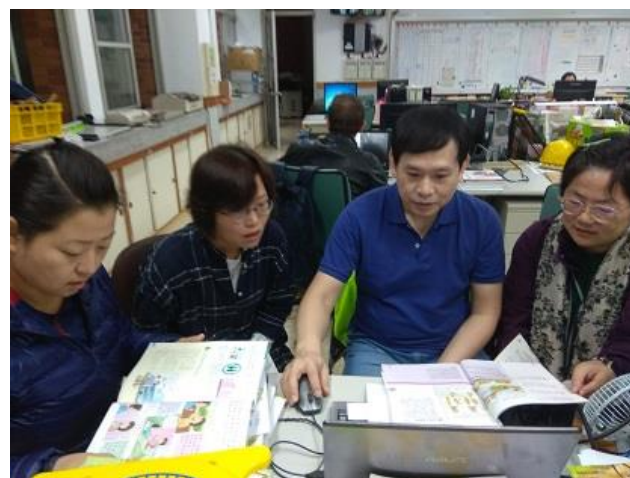
說明：討論預防過敏教學-3