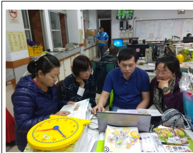
說明：討論預防過敏教學-1