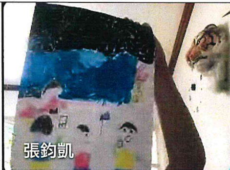
多變的線條-煙火(線上課程)