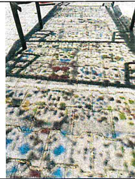
阿嬤的花窗-光影藝術