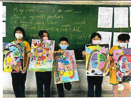
自塑自畫-多媒材拼貼