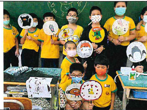
宮廷扇-多媒材藝術運用