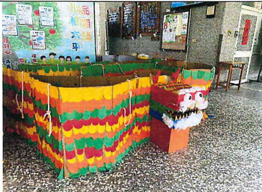
熱鬧的節慶-龍舟團體創作