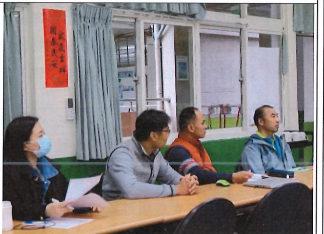
體育教師、英語教師分享心得