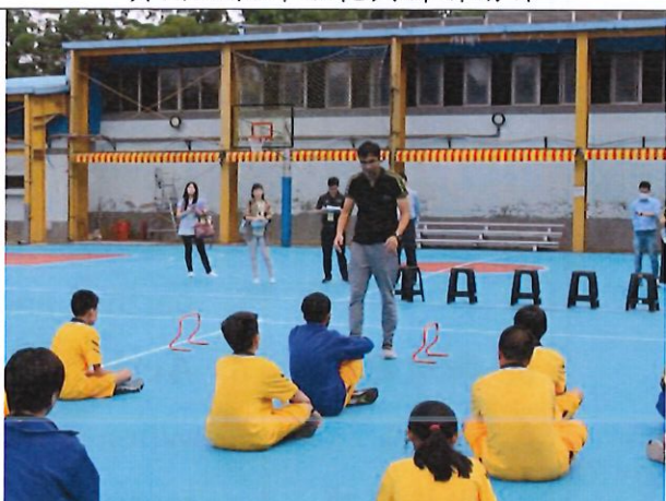
教師總結課程與 QA 時間互動