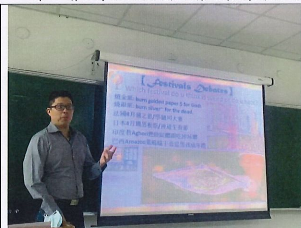
郭易英文介紹不同主題相關英語