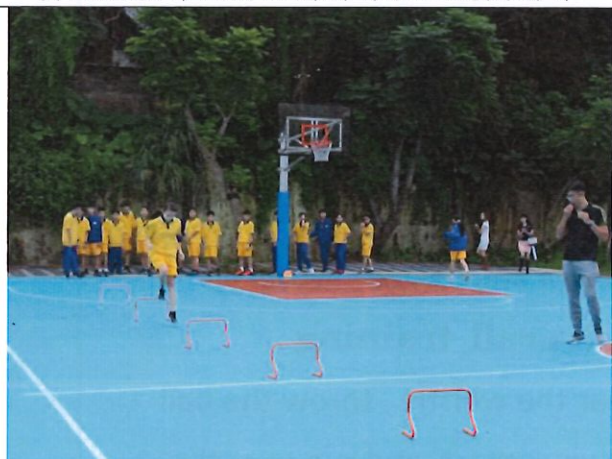
學生練習與教師指導