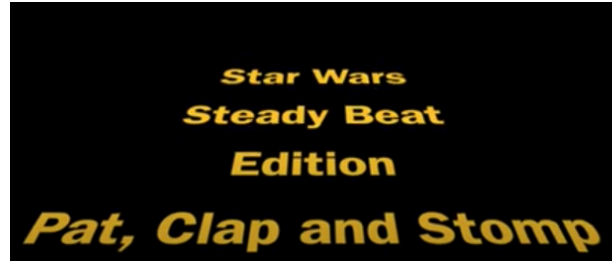
日期：109年10月 說明：身體樂器 Play the body percussion with music ( Pat 、 Clap 、 and Stomp )