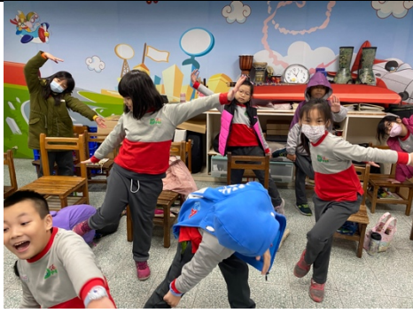
日期：109年10月 說明：個人扮演樹 ( tree )