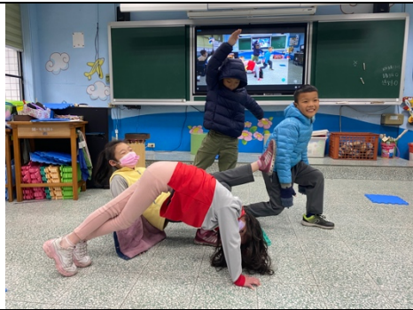
日期：109年10月 說明：小組合作扮演造型樹 ( tree )