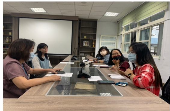
日期：109年11月 說明：教授來訪，蒞臨指導