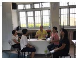
照片說明：與外師共同訂定週一下午英語主題。