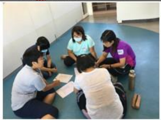
照片說明：英語教師討論週一主題英語進度。