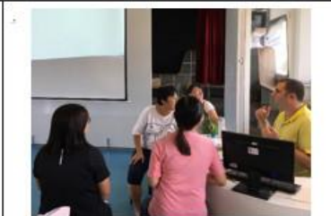
照片說明：與外師討論可行的上課模式。

(須將紀錄務必於會議召開完畢後週五前將本紀錄表寄至共用雲端硬碟/溪尾 NAS/檔案交換/教務主任/109 級組會議紀錄，感謝!)