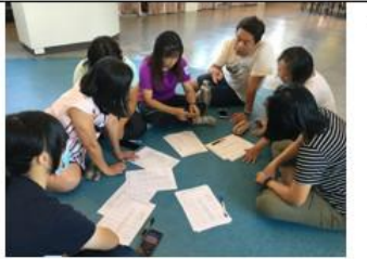
照片說明：與藝術組老師共同討論國際學伴相見歡書法體驗的進行方式。

(須將紀錄務必於會議召開完畢後週五前將本紀錄表寄至共用雲端硬碟/溪尾 NAS/檔案交換/教務主任/109 級組會議紀錄，感謝!)