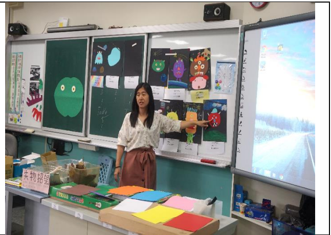
照片 2 準備活動—他人作品介紹與概念導入