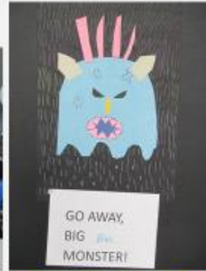
結合萬聖節活動 學生作品