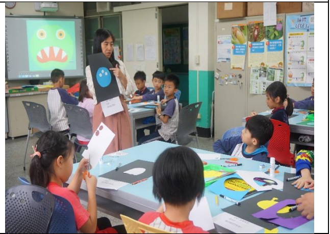
照片 4 發展活動—教師即時回饋