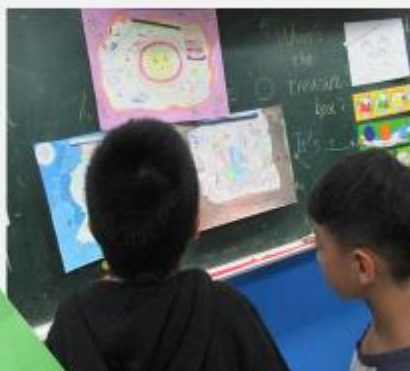
四年級學校藏寶圖