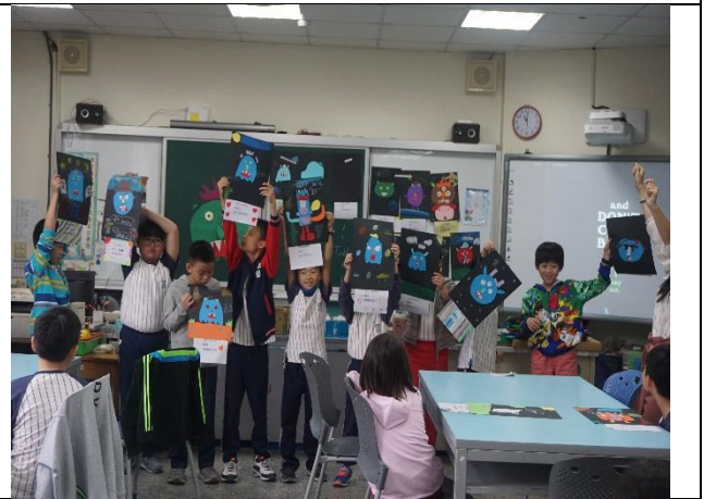
照片 6 綜合活動—成果作品分組發表與欣賞