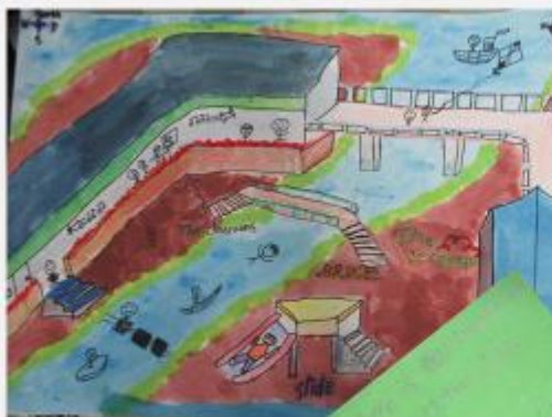
結合方位繪製學校方位圖