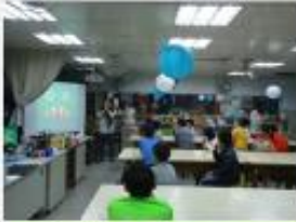
三年級英文繪本導讀