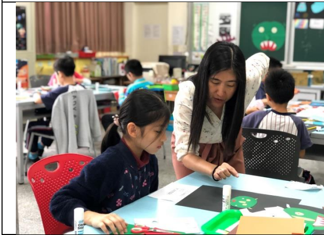
照片 3 發展活動—教師行間指導