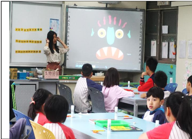
照片 1 準備活動—繪本影片觀賞與說明