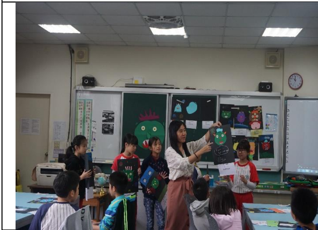
照片 5 綜合活動—成果作品分組發表與欣賞