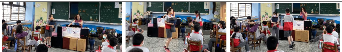
說明：先練習以手拍打鼓的節奏，反覆4次完全正確者先領取盾杯鼓 教師用語：Look at me and follow me. Follow me to play the Djembe.