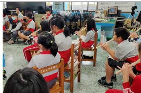
說明：練習吹奏樂曲「心中有歌」〈Song in my heart〉 教師用語：4/4 time is four beats per bar and a quarter note gets one beat. Every 8 beats is a phrase. This song has eight phrases.