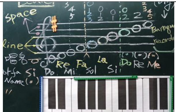
說明：教室情境佈置-4 (音階唱名與鍵盤對照)