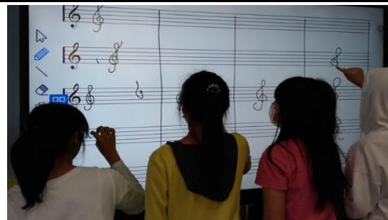
說明：同學們利用互動式電子平板畫出正確的(G clef) 教師用語：It goes from the second line of the staff. There are four important points. Good job. Well down