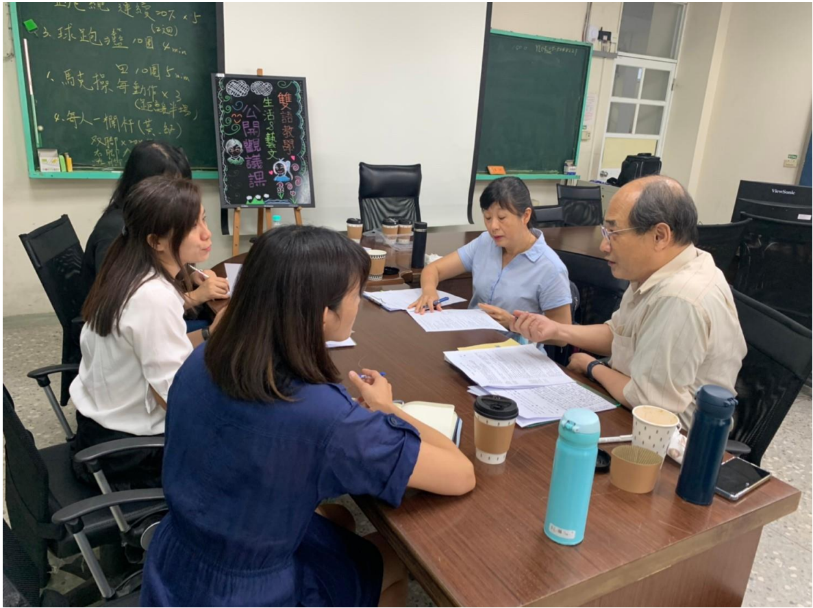
輔導人員入校輔導之佐證照片