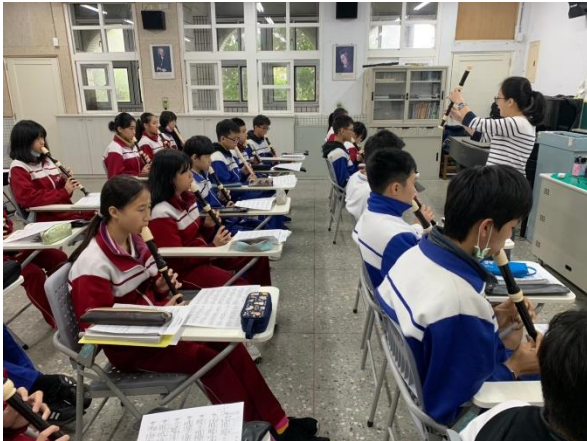
熟悉音樂中的英文課室用語，聽英文提示吹奏直笛