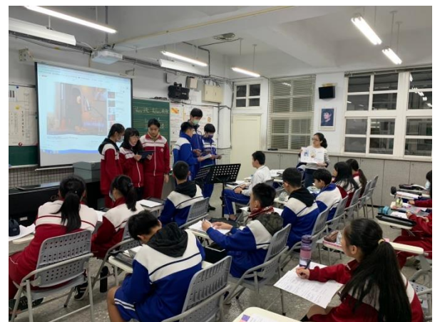
練習以單元重點英文短句分組發表與歌唱