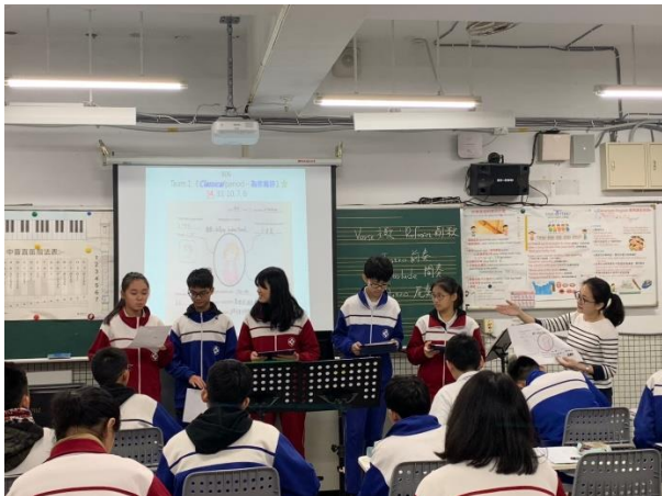
練習以單元重點英文短句分組發表與歌唱