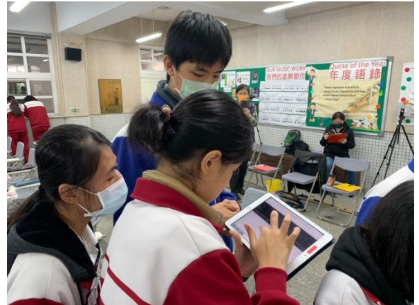
運用 ipad 搜尋音樂相關資訊與練習歌唱