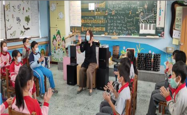
日期: 109.04.20.~ 說明: 歌曲中的四分休止符改以拍手代替