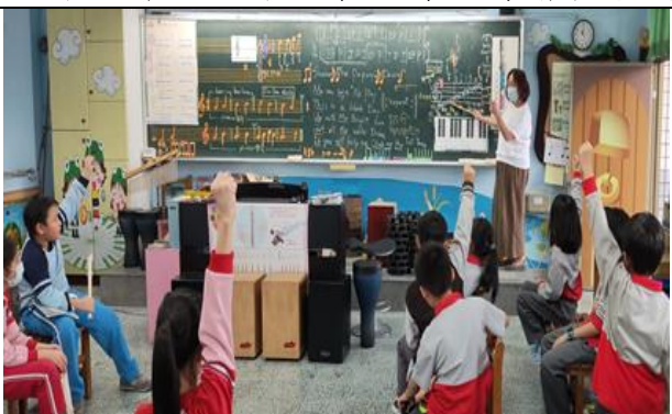
日期: 109.03.10.~ 說明: 搶答以英文說出 Do 到 High-Re 在五線譜上的位置及唱名(Sol-fa Name)