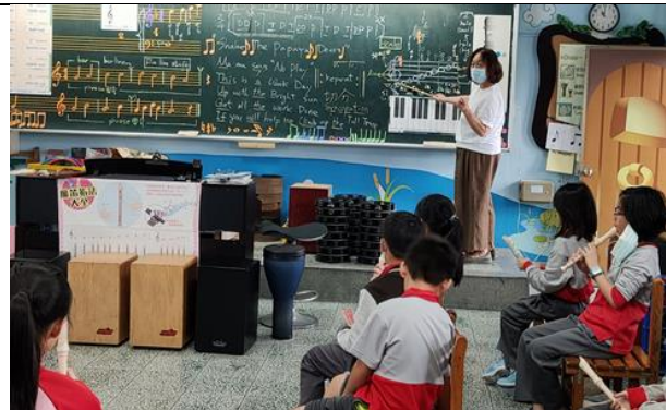
日期: 109.03.10.~ 說明: 下一間 Re 及下一線 Do 在五線譜中的位置