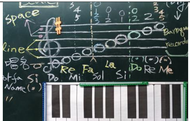
日期: 109.02.25.~ 說明: 教室情境佈置-4(音階唱名與鍵盤對照)