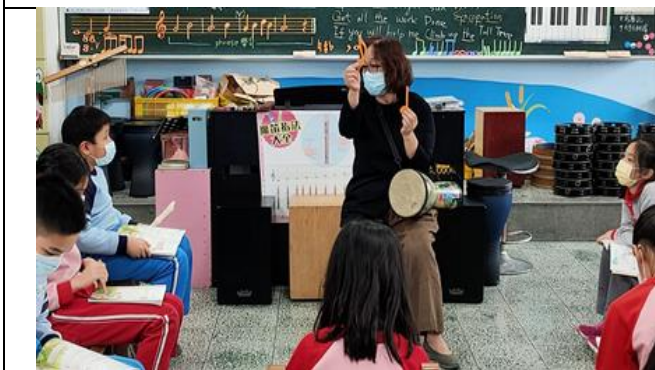
日期: 109.03.17.~ 說明: 說出音符「♪」的英文名稱