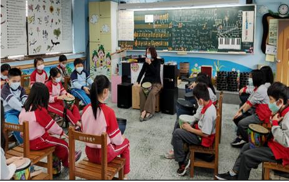
日期: 109.03.25.~ 說明: 練習打金杯鼓的頑固伴奏