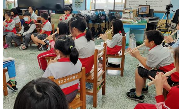
日期: 109.04.13.~ 說明: 習奏樂曲「心中有歌」〈 Song in my heart 〉