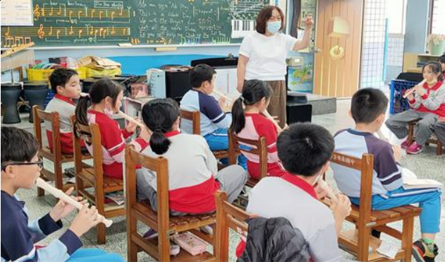
日期: 109.04.06.~ 說明: 習奏樂曲「心中有歌」〈 Song in my heart 〉