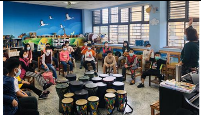
日期: 109.04.20.~ 說明: 歌曲中的四分休止符改以打鼓代替