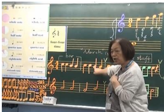
日期: 108.10.15.~ 說明: 練習以英語說出音符的位置