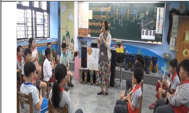
日期: 108.10.01.~ 說明: 吹奏樂句-1~Follow me and repeat this phrase.