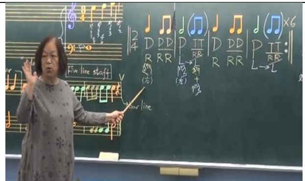
日期: 108.11.29.~ 說明: 打鼓節奏使用 right hand or left hand