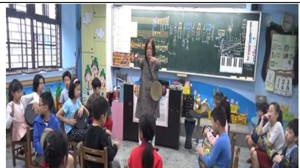
日期: 108.12.12.~ 說明: Please play the Dumbec together.