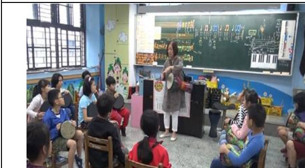
日期: 108.12.12.~ 說明: Teacher fist you after me.