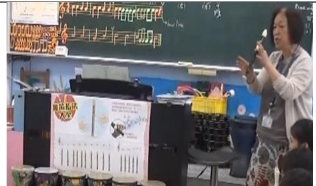
日期: 108.10.01.~ 說明: 吹奏樂句-2~Look at the music score on the blackboard.