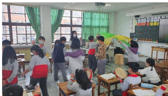
說明:舞蹈、絲巾和樂器做表演