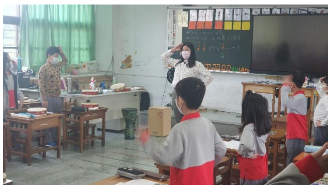
說明:複習舞蹈動作