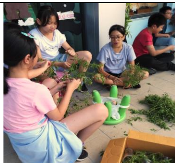
將葉子與莖分開-2 (高年級)