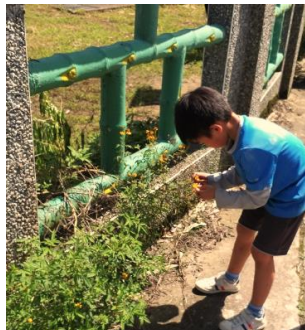
校園內尋找植物材料