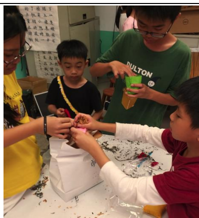
填飾充物入袋後縫製