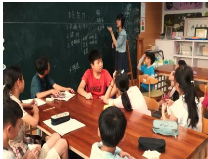
老師說明材料的使用方法