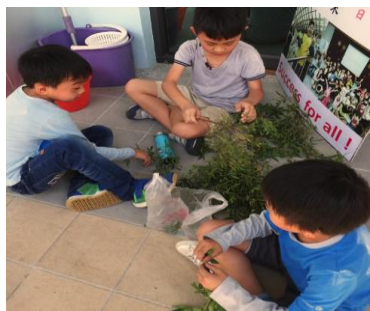
將葉子與莖分開-1(中年級)