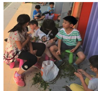
將葉子與莖分開-3 (中年級協助低年級)