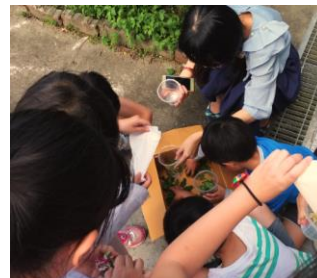
整理收集到的植物材料