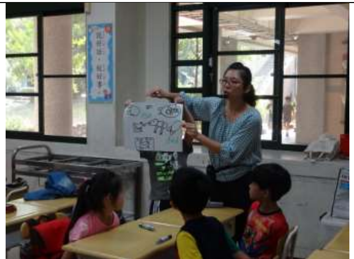
日期: 108.11.08 教師運用影片 -Plastic Planet 引導學生思考地球面臨的困難為何 -第二節