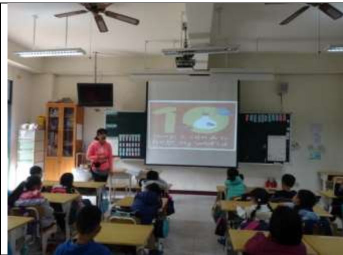
日期: 108.11.26 介紹環保繪本《10 things I can do to help the world》-第五節