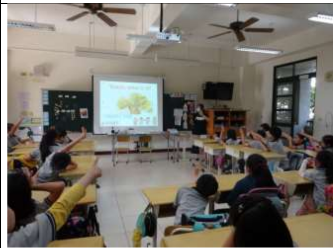
日期: 108.11.12 透過海廢圖鑑的猜謎遊戲讓孩子知道海洋垃圾-第四節