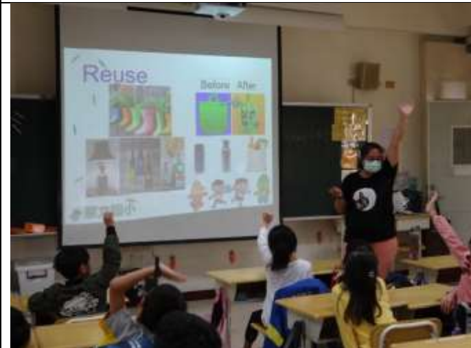
日期: 108.11.12 與孩子討論 3R，透過 3R 愛護地球-第三節