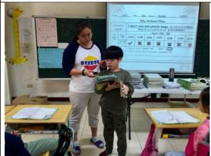
日期: 108.12.10 學生發表自己的環保行動實踐紀錄表-第七節