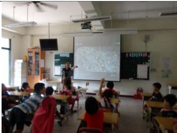
日期: 108.11.01 教師讓學生觀看人類製造的垃圾-第一節