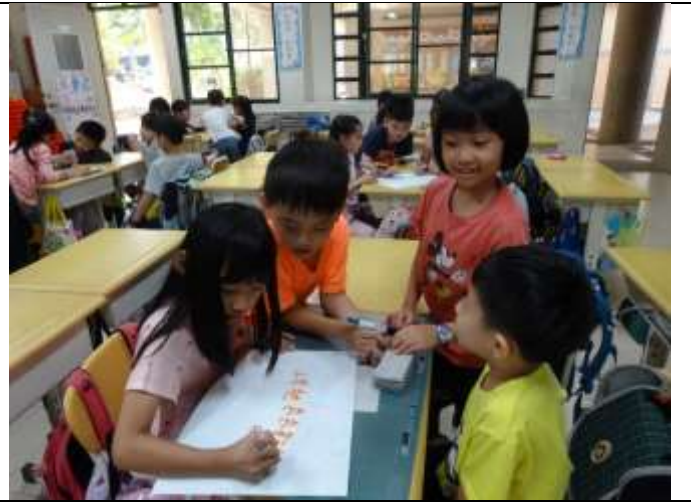
日期:108.11.08 看完 Plastic Planet 後，學生討論情形-第二節