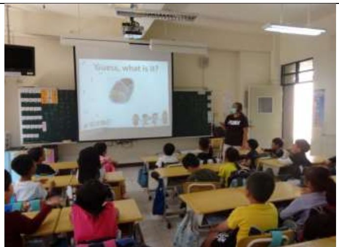
日期: 日期: 108.11.19 透過海廢圖鑑的猜謎遊戲讓孩子知道海洋垃圾-第四節