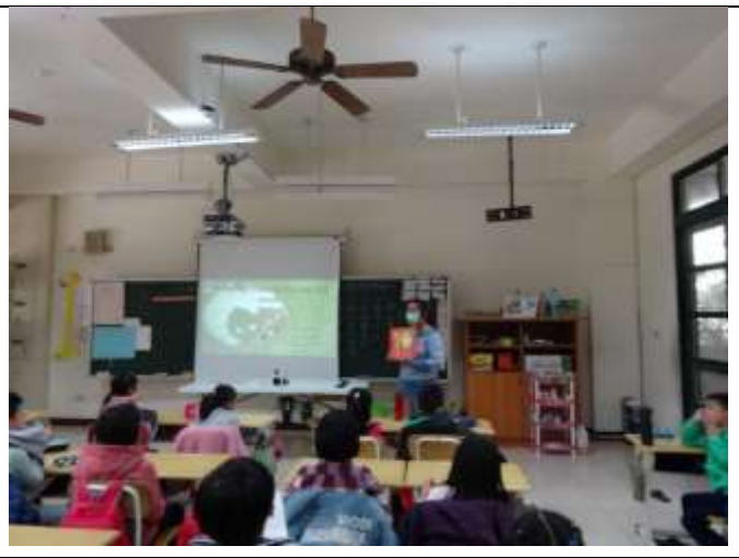
日期: 108.11.29 介紹環保繪本《10 things I can do to help the world》-第五節