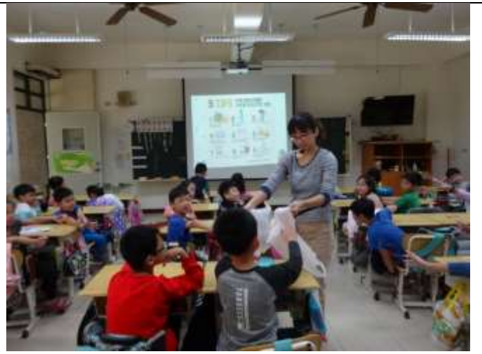
日期: 108.11.15 與孩子討論 3R，透過 3R 愛護地球-第三節