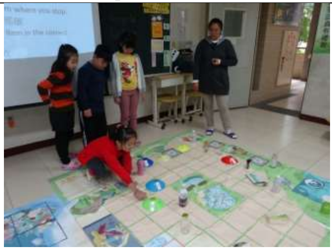
日期: 108.12.06 進行海廢桌游，讓孩子學習減少製造垃圾-第六節