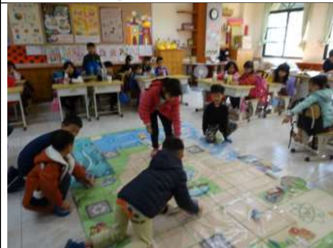
日期: 108.12.06 進行海廢桌游，讓孩子學習減少製造垃圾-第六節