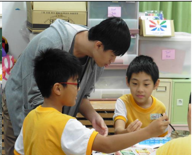
日期:107.9.25 說明:12色環、混色教學，學生練習