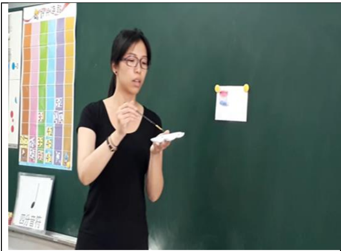
日期:107.10.18 說明:洗色擦色教學(wipe out)