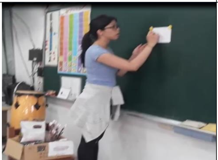
日期:107.10.2 說明:水彩技法-渲染法/防染法(wet on wet/crayon)