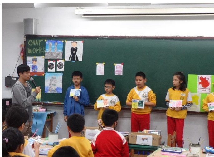
日期:107.11.6 說明:洗色擦色教學(wipe out)卡片分享