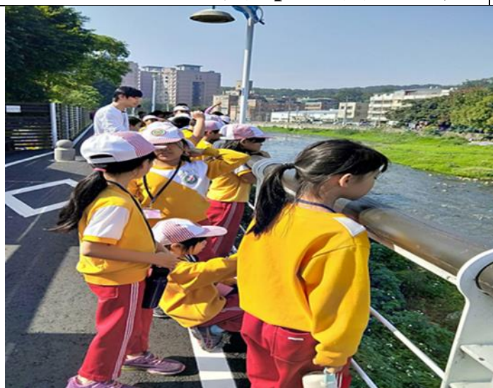
日期:107.12.4 說明:南崁溪生態踏查-風景寫生水彩教學