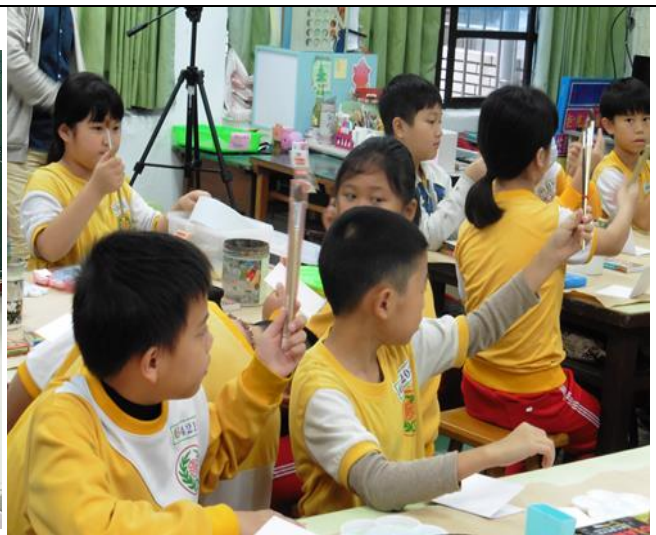
日期:107.9.6 說明:美勞材料用具英語介紹