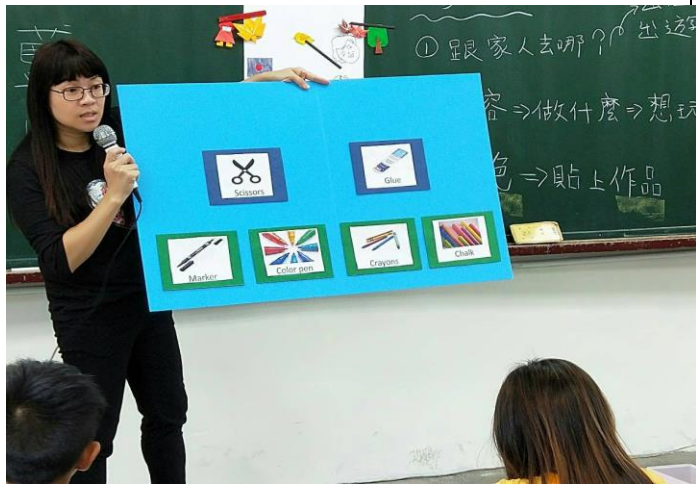
日期:107.9.6 說明:美勞材料用具英語介紹