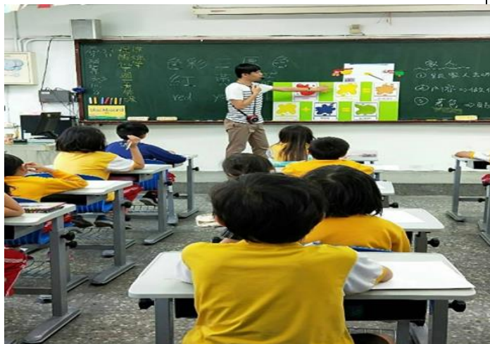
日期:107.9.18 說明:12色環、混色教學