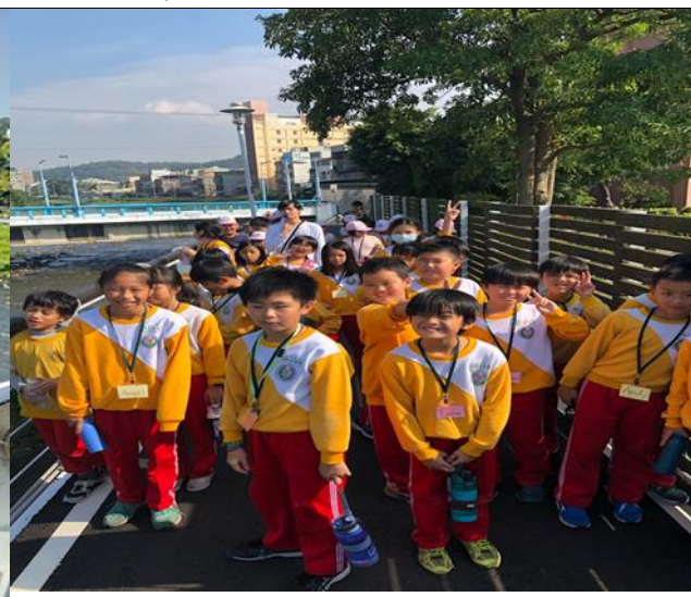
日期:107.12.4 說明:南崁溪生態踏查-風景寫生水彩教學