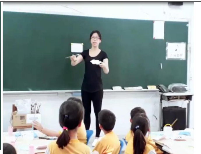
日期:107.10.18 說明:洗色擦色教學(wipe out)