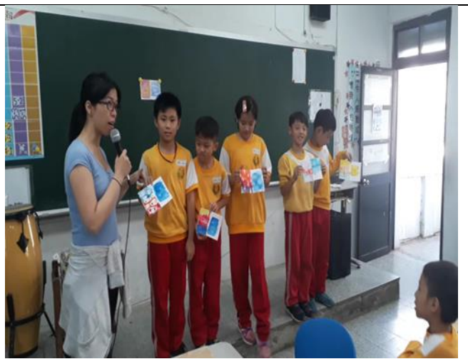
日期:107.10.2 說明:學生作品發表