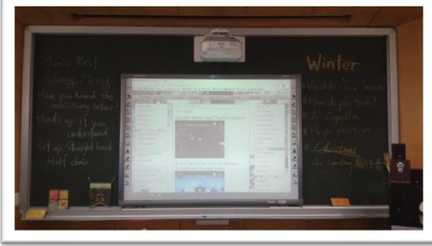
日期:107.11 說明:Winter Topic