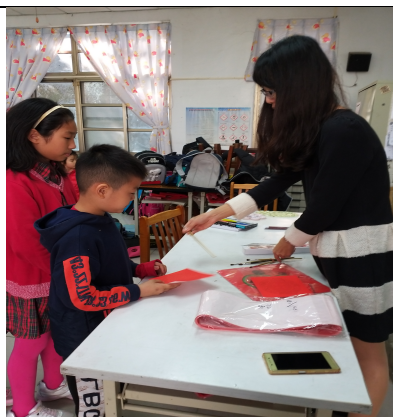
學生正在領用材料。