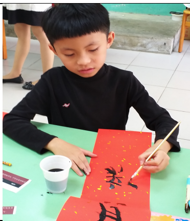
學生正在用水彩寫春聯。