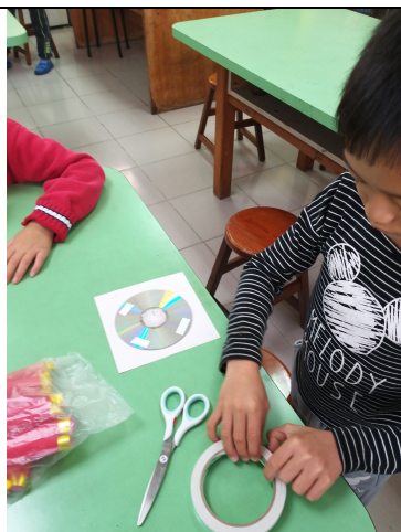
學生正把春聯黏在 CD 上。