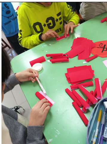
學生正在製作爆竹。