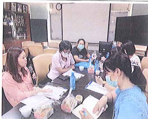
輔導人員入校 輔導之照片