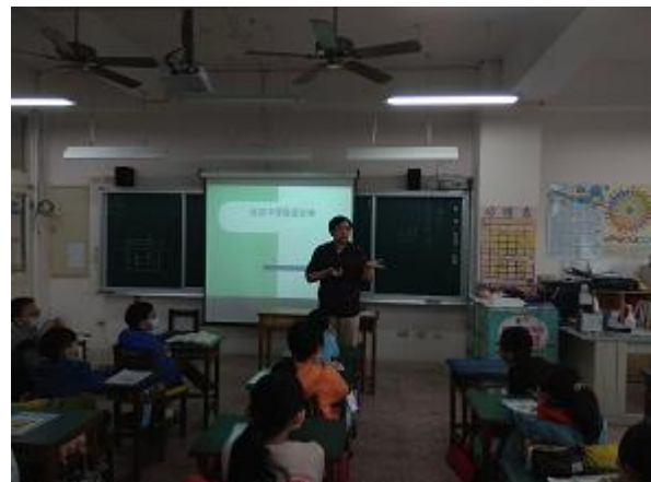
說明：討論性別平等議題