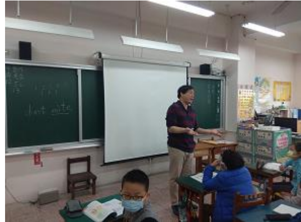
說明：回顧這學期學到的英文-2