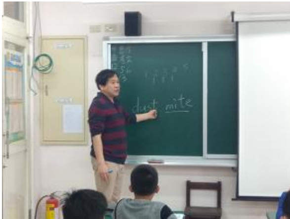
說明：回顧這學期學到的英文-1