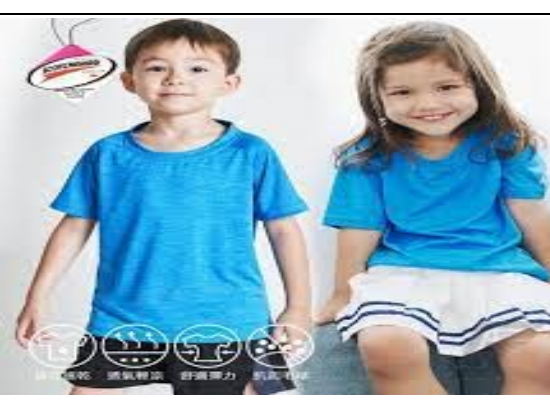
(附件一)夏天情境圖 1-1