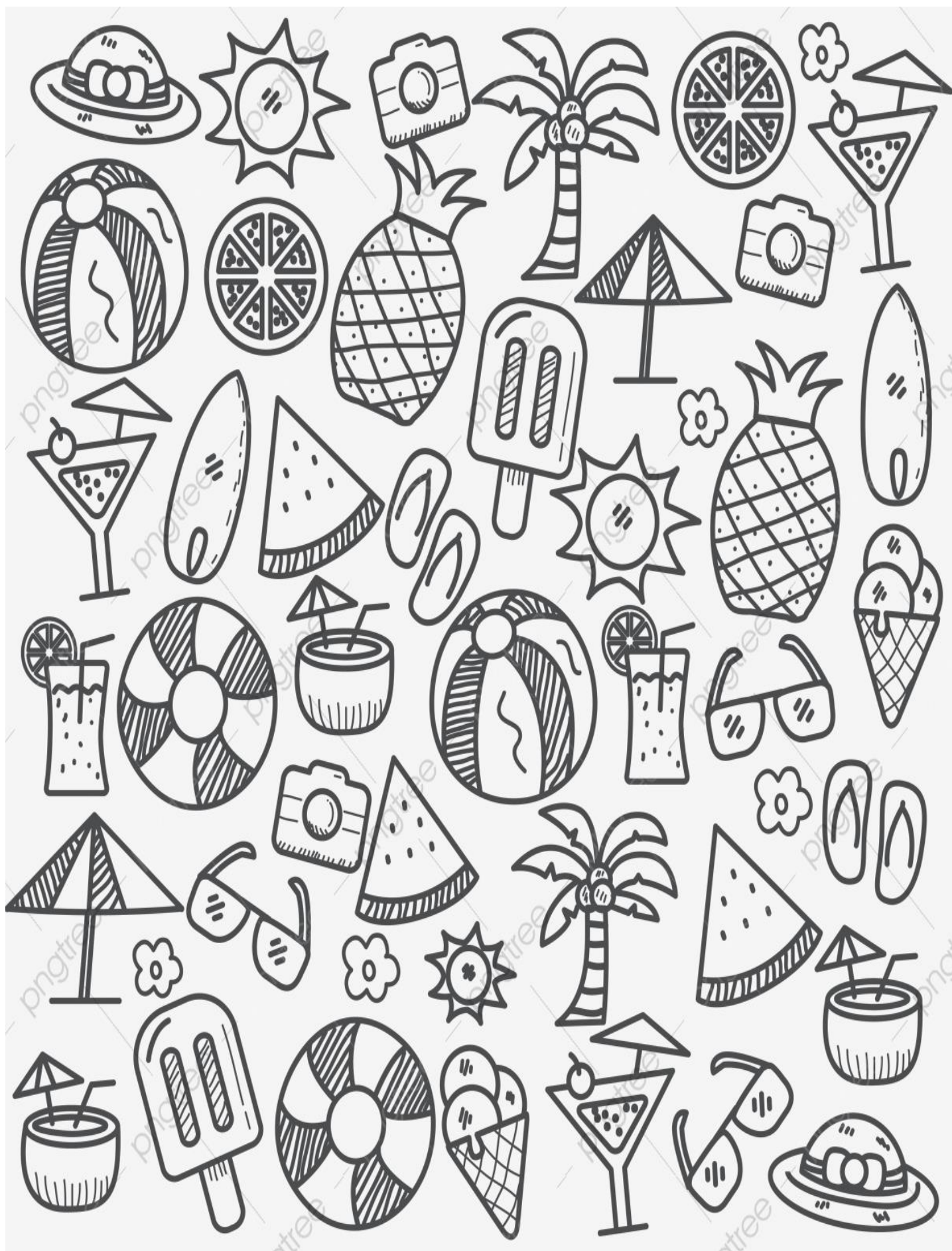
(附件一)夏天情境圖 1-2