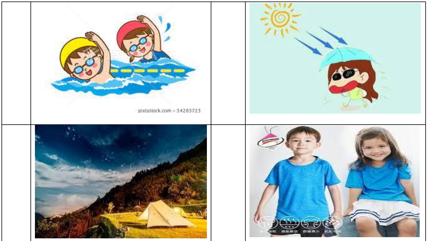
(附件一)夏天情境圖 1-1