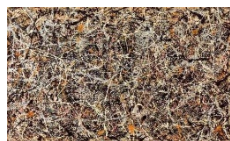
1948 年第 5 號

ET: Let's give a name to your work. Please write down your name, the topic and price for your work.