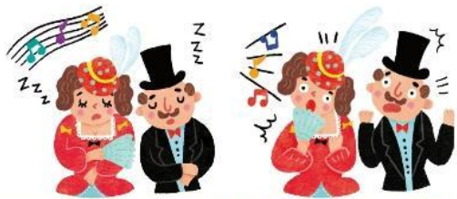
音樂故事館—海頓〈驚愕交響曲〉 海頓〈驚愕交響曲〉

海頓出生於奧地利，從小就展現他的音樂才華，八歲考上維也納聖喬治學校，長大後又成為宮廷裡的樂師指揮，一生創作了許多交響樂曲。海頓個性開朗，人們可以從他的音樂作品中發現他幽默風趣的一面。