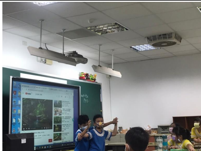
Students work in pairs to form a tree through body language.