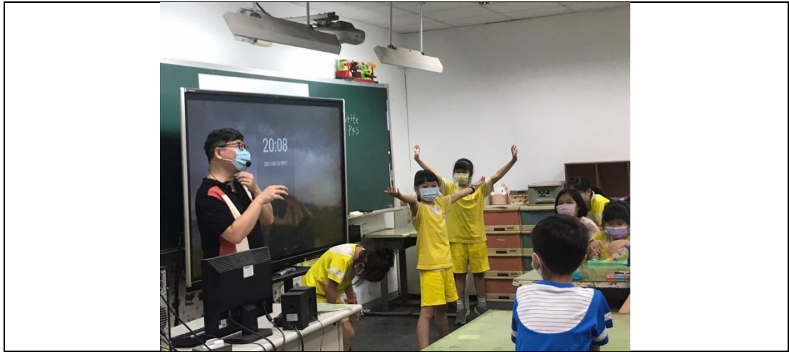
Students imagine they are a tree.