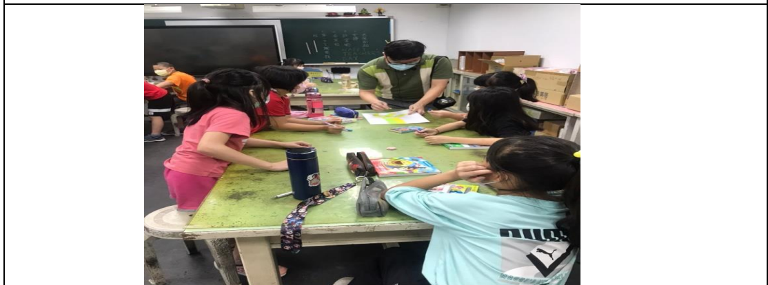
Teacher goes to every group to demonstrate how to paint the tree.