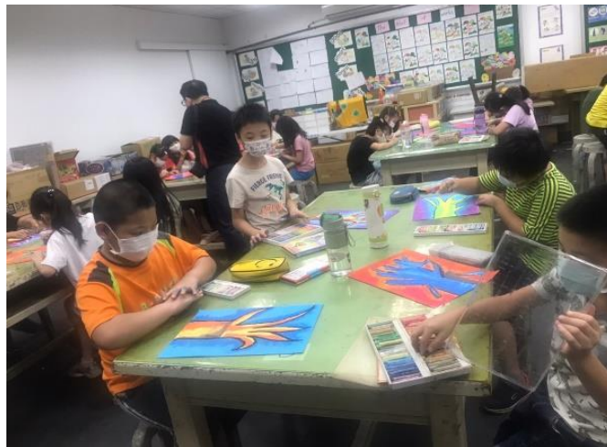
Students are working hard.