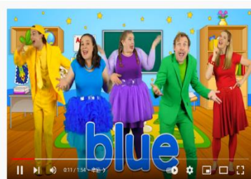
Colors Finger Family - Learn Colors with the Finger Family Nursery Rhyme | Baby Songs