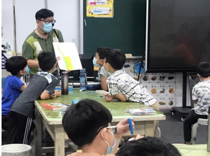
Teacher checks students' works and explains in details.