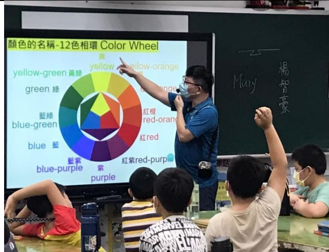
Introducing 12 color wheel as review of colors.