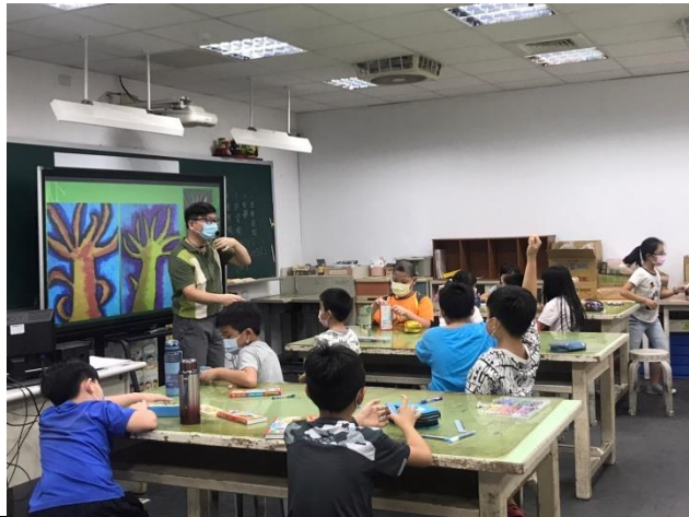
Teaching how to draw a tree through presenting the works.