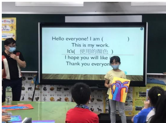
Students present their works in English.