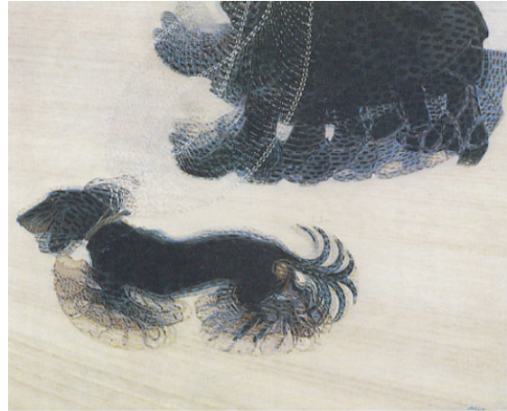
*巴拉 『拴著皮帶的狗』