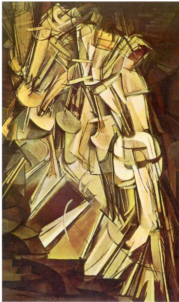
*杜像 『下樓的裸女二號』