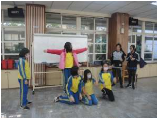
The Ugly Duckling