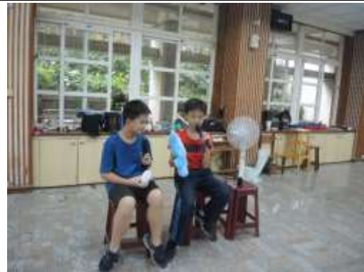
想回外太空的外星寶寶