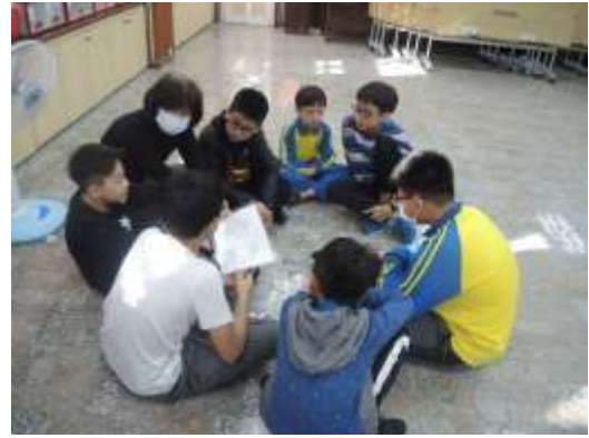
小組討論故事劇場