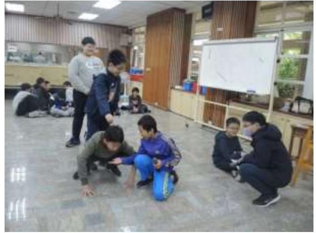
A Sunday on da Grante Jatte