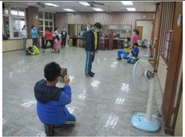
Take a perspective photo