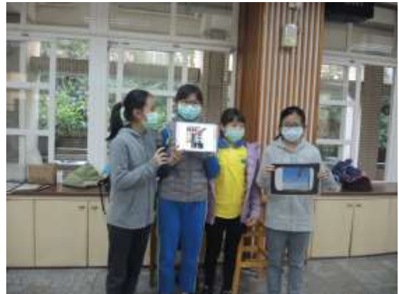
Tell the Story