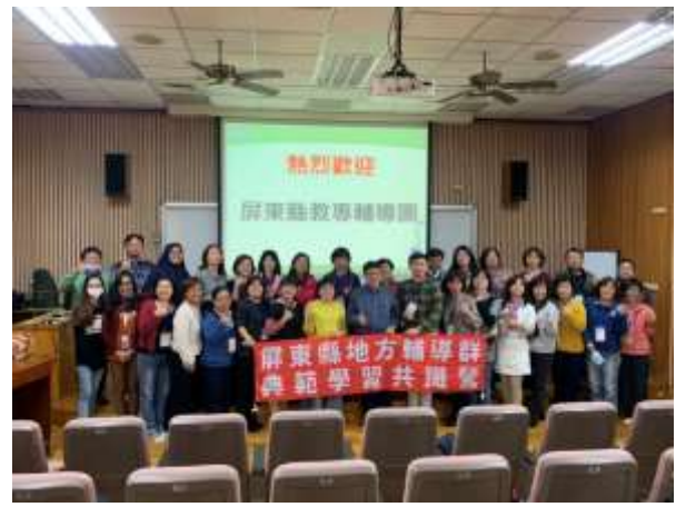
屏東教專團觀課與會談