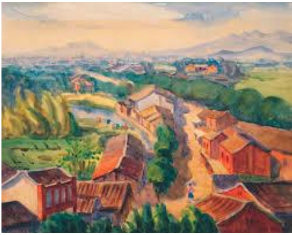
廖繼春<有香蕉樹的院子>