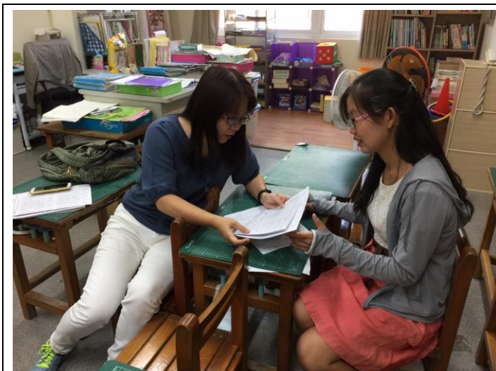
教學團隊共同備課討論