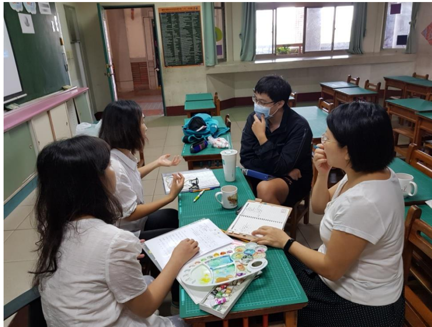
教師們共備課程照片

more details and realistic、make lines thick and thin、press it deep enough、ink can not be too much or too little